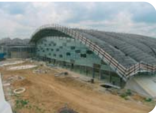
Vue extérieure de la piscine

Plusieurs années ont été nécessaires pour concrétiser le projet d'un complexe regroupant Piscine, Patinoire et Bowling. Le permis de construire a été délivré en Mars 2001. Le chantier proprement dit a démarré en septembre 2003.