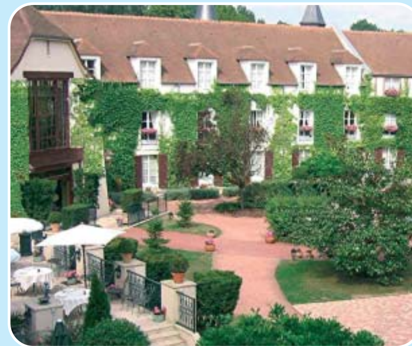
Cour intérieure - Manoir de Gressy

Le département, comme son nom l'indique est proche de la nature, de la forêt et surtout de l'eau avec toute l'imagerie agréable et ludique qui l'entoure : l'ambiance des guinguettes, les balades sur les berges du canal de l'Ourcq, la descente de la Marne en canoë - de quoi proposer "le Raid Aventure", un idéal de détente et surtout une exclusivité du Manoir de