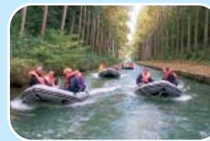
Descente du canal de l'Ourcq

connaître - fêter de bons résultats, parce ce que ça se sait et que c'est attendu". Rassurez-vous, on peut aussi s'y surpasser et être acteurs ensemble.