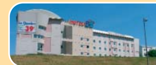
Hôtel B &amp; B à Roissy

Parfait pour le voyageur de passage : une chambre toujours propre, une