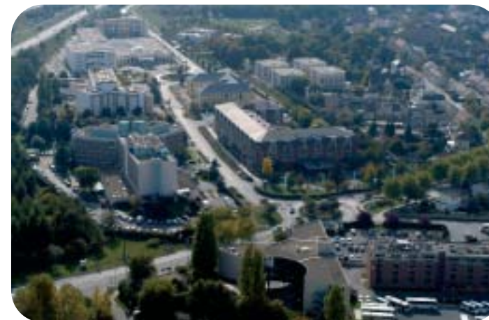
Vue aérienne du pôle hôtelier

Pour vous aider aux mieux de vos demandes, la Communauté de Communes Roissy Porte de France vous accueille, vous informe et vous accompagne :