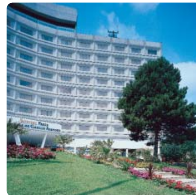
Jardins botaniques agencés

sation) dont Accor Services assure la conception et la gestion.