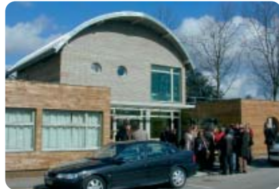
Crèche "les globes-trotteurs"

avait pour thème "la crèche" innovante interentreprises. "Les globes trotteurs de Roissy", projet réalisé sur la plate forme, intéressait beaucoup nos amis. A leur demande, nous avons participé à l'organisation matérielle de cette journée qui s'est avérée extrêmement enrichissante. Explication du projet, intervention de spécialistes, visite de la crèche, ont donné des idées aux différents gestionnaires de parc d'activités. La mutualisation d'une crèche, comme celle d'espace vert, est très intéressante dans le cadre d'une gestion pérenne des zones. Mais ça c'est un autre problème, et nous souhaitons à ROISSY ENTREPRISES qu'il devienne très rapidement un sujet majeur de préoccupation des créateurs de zones. Améliorer les zones où nos entreprises travaillent, c'est un des axes de l'action militante de notre association. Nous reverrons nos amis au dernier tri-