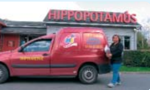
La distribution de Trait d'Union

Idéal pour un déjeuner : grillades colorées et gouteuses pour un déjeuner de travail efficace. Très pratique, mettez ce restaurant dans vos tablettes.