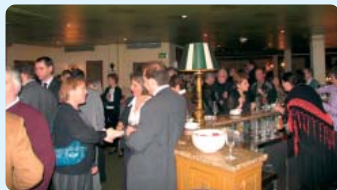
Bar du Manoir de Gressy