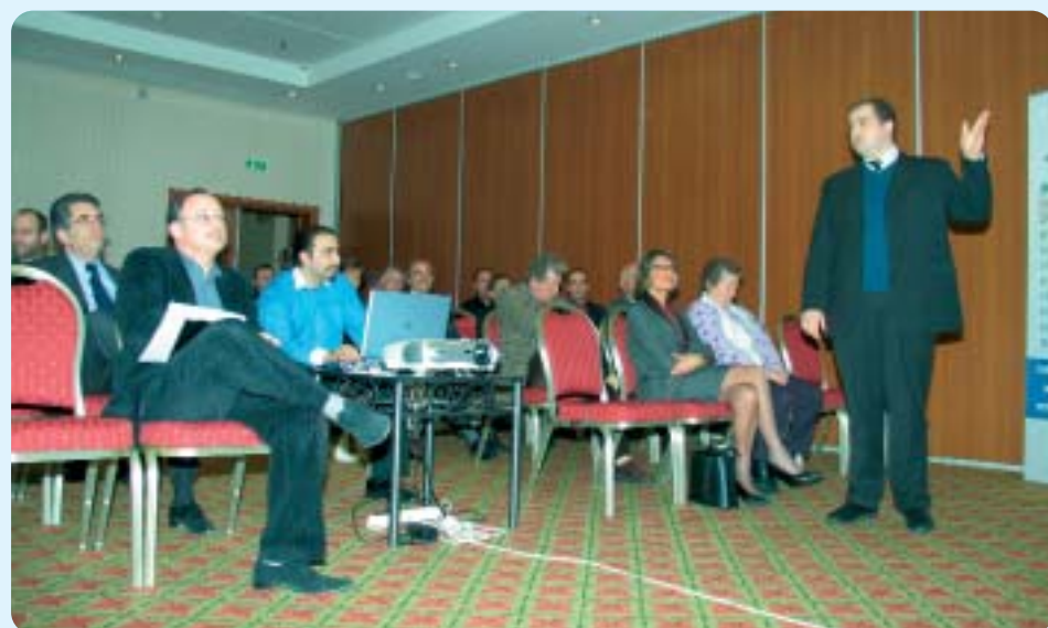
Le discours du Président