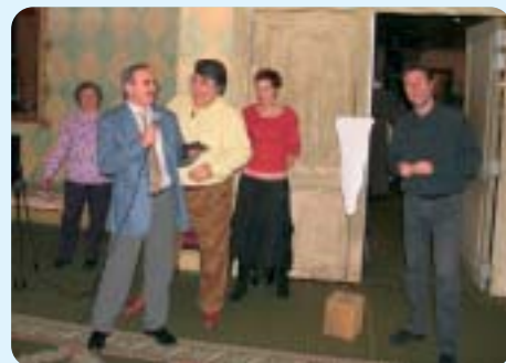
Le gros lot !

Cette association des Chefs d'Entreprises sympas, est capable de créer des événements de plus en plus étonnants... !!!