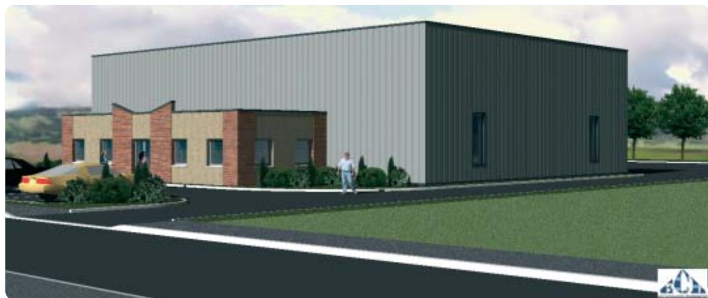
Projet Saint-Gobain PAM

Pour en savoir plus : www.paysderoissy-cdg.asso.fr www.lartacdg.com