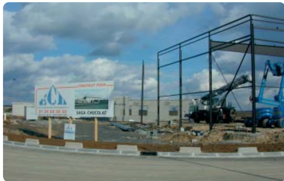
Construction Saga Chocolat

Coup double. Quel est le secret de Siegfried : écouter son client, trouver