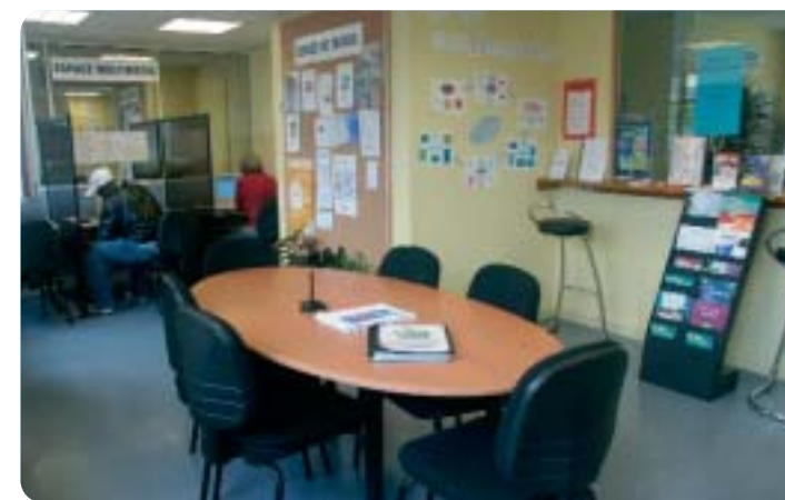
L'antenne de Villepinte