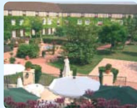
Le Manoir de Gressy