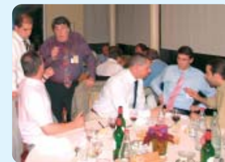
Convivialité, contacts : la tradition

A partir de la définition du développement durable :