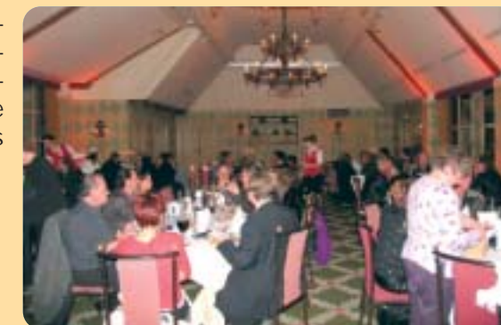
Soirée de gala 2005 au Manoir de Gressy

La plus pure tradition de notre sympathique association avec sa tombola d'une autre époque, mais toujours animée et chaleureuse.