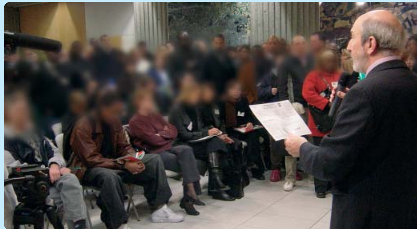
Qui sont-ils, tous ces chômeurs qui veulent vraiment un emploi ?

essentiellement sur la volonté, le dynamisme et l'esprit d'équipe. 3 POSSIBILITÉS SONT OFFERTES pour rencontrer les entreprises: