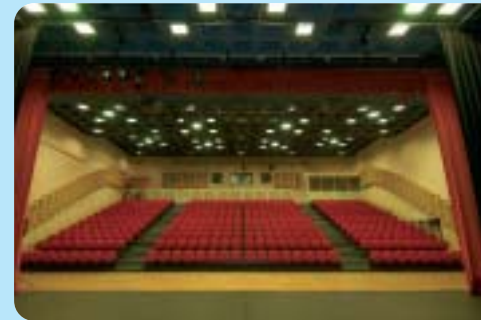
La grande salle de 416 places

Ce magnifique complexe propose, tout au long de l'année, de nombreuses et diverses expositions, ainsi qu'une médiathèque ouverte à tous. C'est une salle de spectacles qui accueille régulièrement des pièces de théâtre, des concerts... Une nouvelle saison culturelle vient de débiter (demandez le programme).