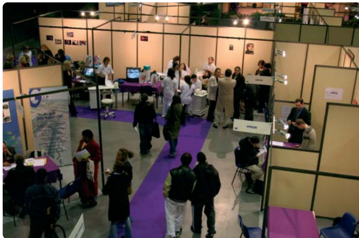
Le forum de l'emploi 2006 à Villepinte

Commentaire RE : Bienvenue à la nouvelle structure. ROISSY ENTREPRISES est prête aussi à participer à tout projet économique social qui favorise l'emploi et permette aux PME et PMI de se développer avec des investissements en personnel rentables.