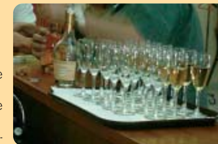
Les verres de l'amitié

Demandez le tarif et le programme. Réservez le plus tôt possible au secrétariat.