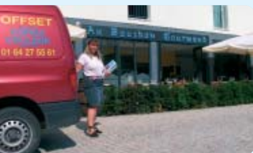
La distribution de Trait d'Union

La recette est bonne : un patron très sympa, des ingrédients typiquement régionaux, une cuisine familiale traditionnelle, des produits fait maison, une carte qui tourne avec de bons petits plats et le vin du mois. Que diriez-vous de tripes à l'auvergnate aux aromes délicats et parfumés ou bien un croustillant de pied de porc