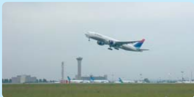
Le pôle d'attraction CDG

Tout repose sur un constat banal mais terriblement évident : au moment de la création