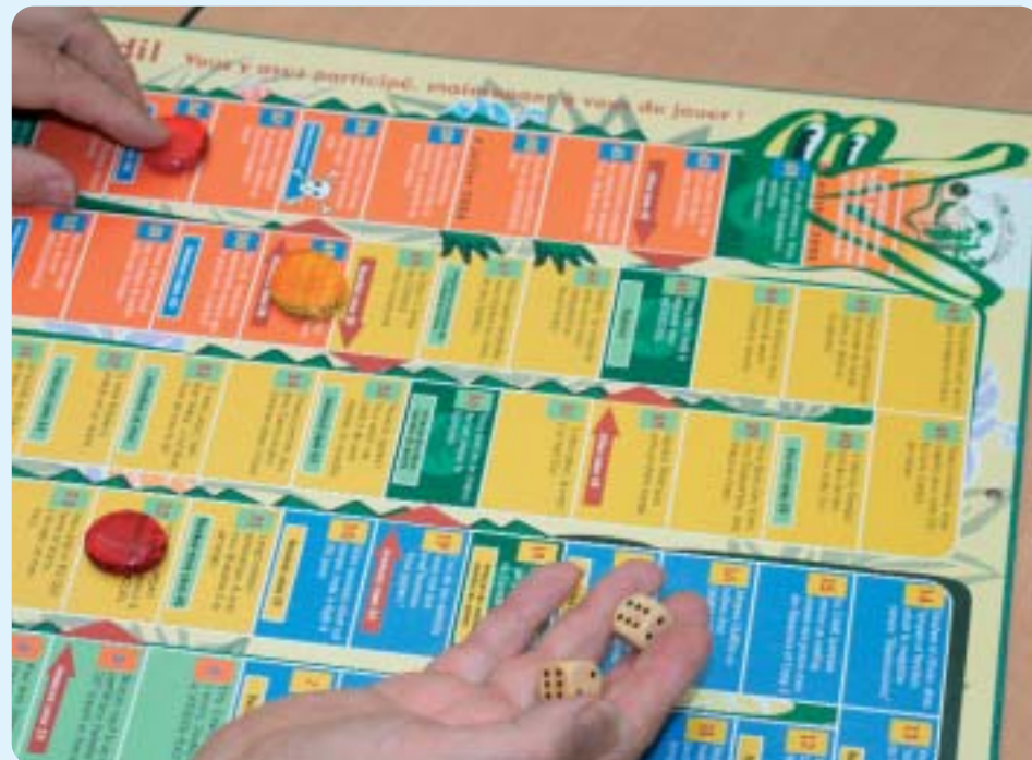
Jeu de l'oie, édition spéciale Microcodil

Le Cabinet D. Lapière est spécialisé dans les risques d'entreprise depuis 26 ans. Installé en 1980 au centre d'affaires PARIS NORD puis en 2003 à ENGHEN LES BAINS, il s'est beaucoup investi auprès des PME et PMI du pôle de ROISSY.