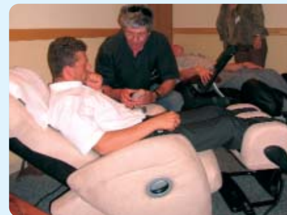
Moment de relaxation grâce à MJL Bureaux